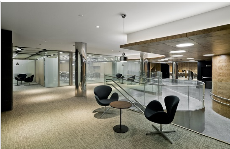
Meeting Place de Castellana 81

Castellana 81 ha sido elegido por empresas como HAYS, Teka, Savills Aguirre Newman, Elecnor y Faborit.